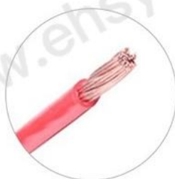
多股硬线 0.08~4.0mm 2