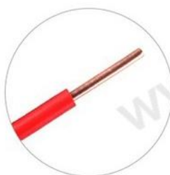
单股硬线 0.08~4.0mm 2