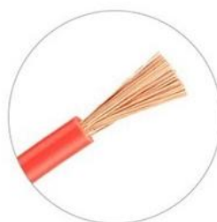
多股软线 0.08~2.5mm 2