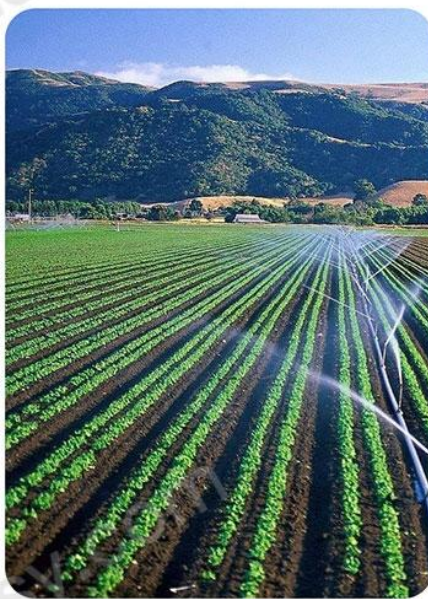
农业抽吸输送水、油、粉料