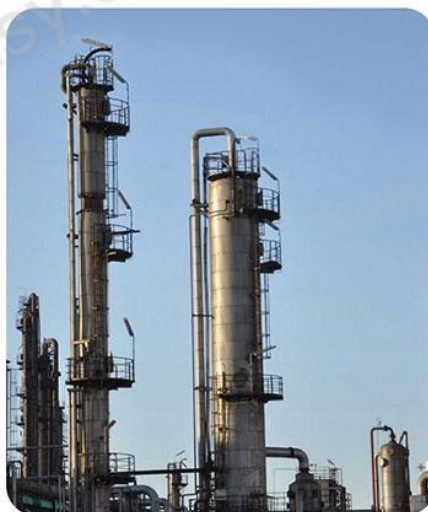
工业抽吸输送水、油、粉料