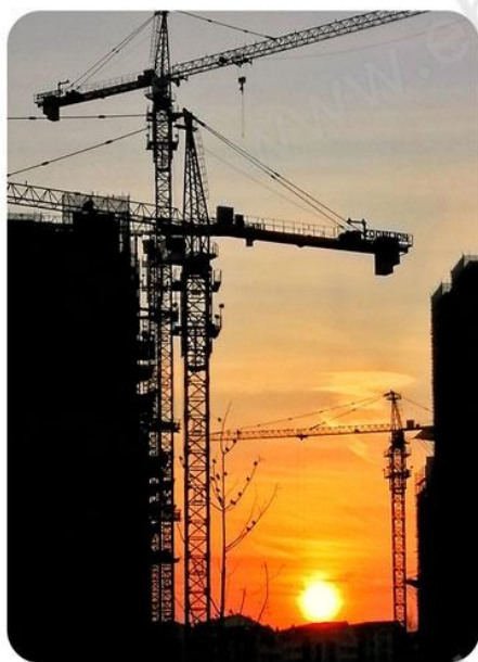
工程抽吸输送水、油、粉料